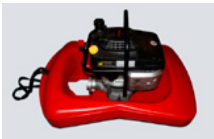
Plovoucí čerpadlo Kawasaki Aquafast Výkon 1180l/min, hmotnost 27 kg

Slouží k transportu a fixování osob, transportu materiálu