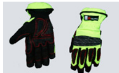
Zásahové rukavice Holík Lesley odolné rukavice k technickým zásahům