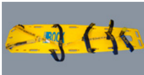
Transportní páteřní deska Spencer Rock

Slouží k transportu a fixování osob, transportu materiálu