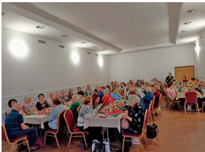
Setkání v Kynžvartu