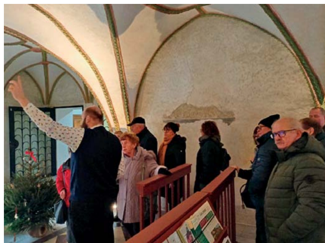
Městské muzeum Cheb