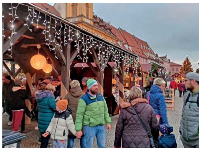
Vánoční trhy v Chebu