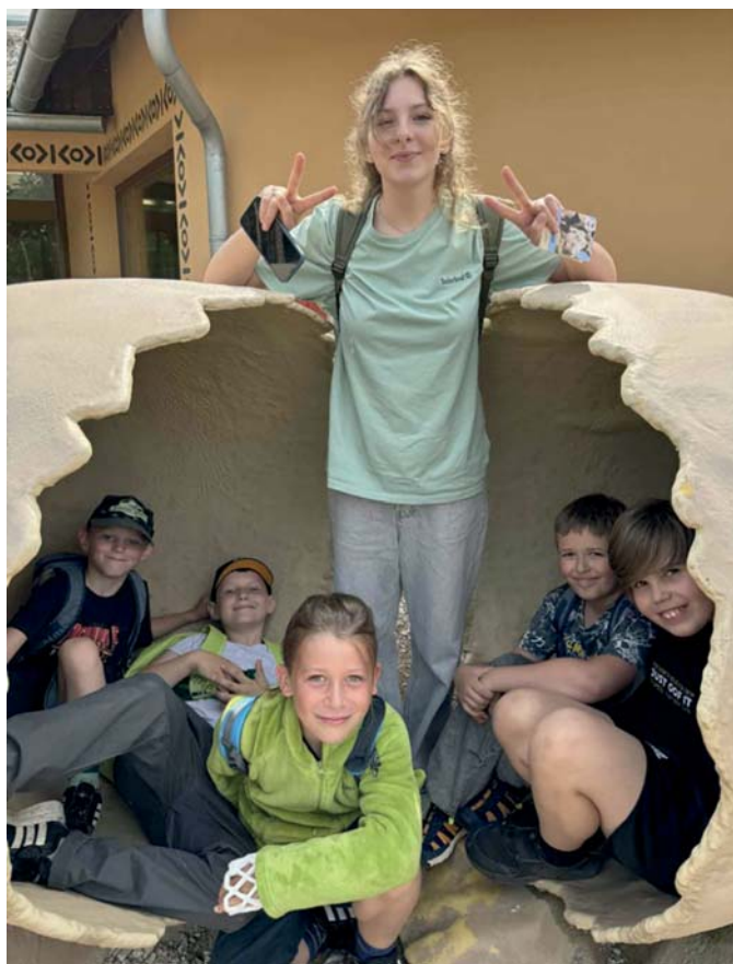
Výlet za klokanem