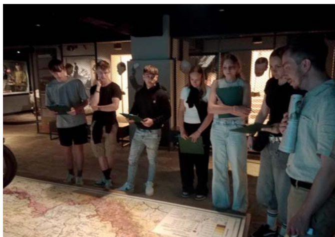
Muzeum v Praze