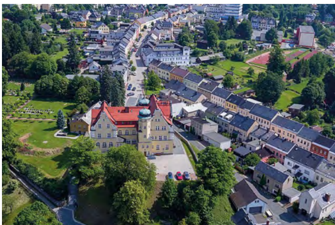
Partnerský Schöneck v nedalekém saském Fojtsku (Vogtland)

Město Lázně Kynžvart realizuje svůj první česko-saský projekt nesoucí název „Partnerství Lázně Kynžvart - Schöneck!“. Tento název není náhodný. Obě města jsou oficiálními partnery a cílem tohoto projektu je mj. kdysi uzavřené partnerství znovu oživit. V rámci projektu byly spolufinancovány aktivity při dětské pohádkové cestě ke zřícenině hradu či zahájení lázeňské sezóny. Realizoval se společný výlet na pevnost Königstein a do Drážďan. V srpnu se budou konat i cesty do partnerského Schönecku a jeho okolí. 14. - 16. srpna 2021 se bude konat „Schöneck Heimatfest“, kde si Schöneck připomene i jubileum 650 let od svého založení. Toto krásné horské středisko letních i zimních sportů v nedalekém saském Fojtsku určitě stojí za návštěvu!