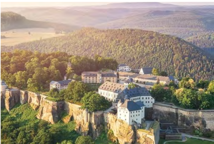
Pevnost Königstein v překrásné krajině saského Švýcarska