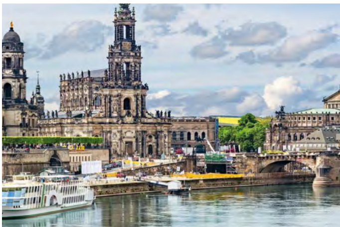
Barokní perla na Labi - Drážďany

Je velice pozitivní, že díky společnému projektu může být rozvíjeno partnerství, být realizováno setkávání obyvatel a poznávání tradic, kultury, minulosti i současnosti na druhé straně hranice.